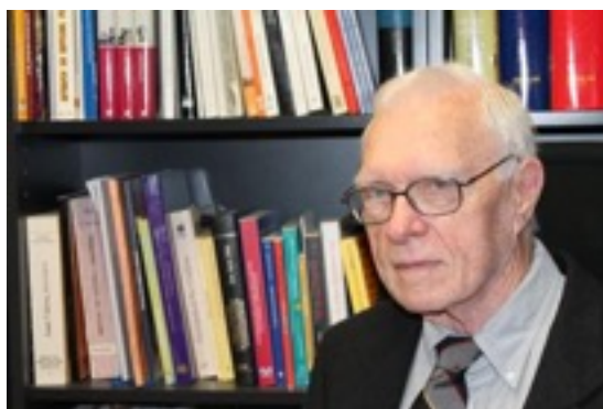
Stanley G. Payne

11. Qué piensa de las obras de Hugh Thomas y Stanley G. Payne? Y qué opinión tiene sobre las de Preston?